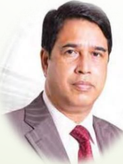
জালাল আহমেদ যুগ্ম সচিব, অর্থমন্ত্রণালয়